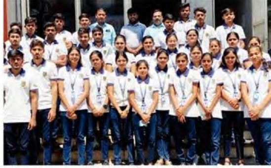
इंदिरा गांधी रुग्णालयाच्या भेटीप्रसंगी आर.सी. पटेल फार्मसीचे विद्यार्थी.

नोंदणी कक्ष, सरकारी योजना माहिती कक्ष, नर्सिंग स्टेशन, कॅजुअल्टी विभाग, इन पेशंट, आऊट पेशंट, औषधी विभाग, निजंतुकीकरण विभाग,