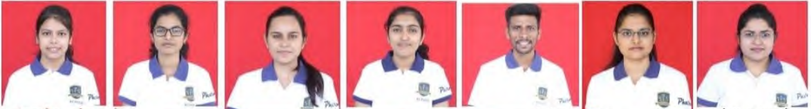
(युनायटेड खान्देश वृत्तसेवा)

शिरपुर, दि.२७ - आर. सी. पटेल फार्मसी स्वायत्त महाविद्यालय शिरपुर द्वारे घेण्यात आलेल्या एम.फार्मसी द्वितीय वर्ष प्रथम सत्र परीक्षेचा निकाल जाहीर झाला असून विद्यार्थ्यांनी प्रवर्धनात यश संपादन केले आहे.