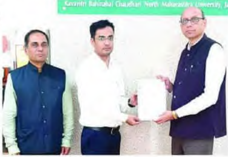
Kavayitri Bahinabai Chaudhari North Maharashtra University, Jalgaon