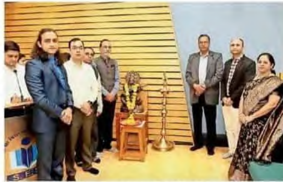
शिरपूर येथे झालेल्या कार्यशाळेच्या उद्घाटनप्रसंगी उपस्थित मान्यवर.