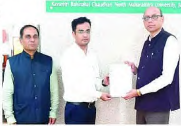
Kavayitri Bahinabai Chaudhari North Maharashtra University, Jalgaon