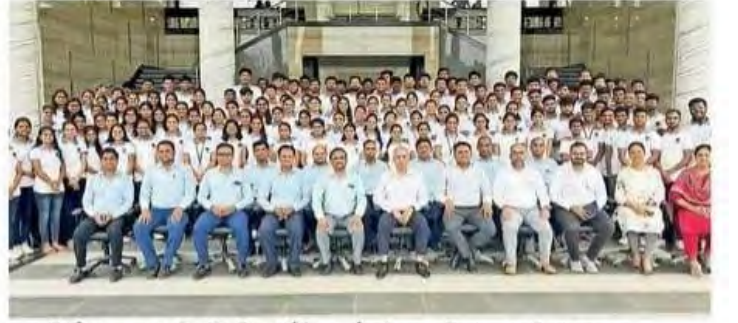
आर.सी.पटेल स्वायत्त अभियांत्रिकीत आयोजित उद्योगाभिमुख प्रशिक्षणात उपस्थित मान्यवर.

व्यावसायिक आणि तांत्रिक कौशल्यांना विकसित करण्यासाठी महाविद्यालयात या प्रशिक्षणाचे आयोजन केले होते. सदर उपक्रमात १६९ विद्यार्थ्यांनी सहभाग तंत्रज्ञानाचे प्रात्यक्षिक अनुभव आघारित सखोल ज्ञान प्राप्त केले. या प्रशिक्षणाचा मुख्य उद्देश विद्यार्थ्यांना कोर जावा, अॅडव्हान्स्ड जावा, सिंग प्रेमवर्क यांसारख्या आधुनिक तंत्रज्ञानाचे व्यावसायिक ज्ञान आणि प्रात्यक्षिक अनुभव देणे हा होता. या २६ दिवसांच्या सखोल प्रशिक्षण सत्रामध्ये, विद्यार्थ्यांना उद्योग-मान्य सॉफ्टवेअर डेव्हलपमेंट प्रक्रिया, ऑब्जेक्ट-ओरिएटेड प्रोग्रामिंग, तसेच वेब ॲप्लिकेशन्स तयार करण्याचा प्रत्यक्ष अनुभव देण्यात आला. यामुळे विद्यार्थ्यांना उद्योगाच्या गरजांनुसार तयार होण्यास मदत झाली.