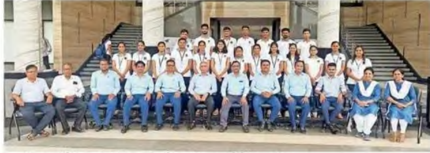
जपानी भाषा परीक्षेतील यशस्वी विद्यार्थ्यांसमवेत उपस्थित असलेले शिक्षकवृंद.

परीक्षेत यशस्वी झालेल्या गुणवंत विद्यार्थ्यांचा महाविद्यालयात केला गौरव