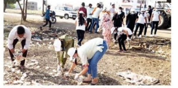
शिवमहापुराण कथेनंतर आयोजित स्वच्छता मोहिमेत सहभागी झालेले विविध संस्थांचे प्राध्यापक व कार्यकर्ते

स्वयंसेवक विद्यार्थी, राष्ट्रीय सेवा योजना विद्यार्थी तसेच शहर व परिसरातील पदाधिकारी, महिला पदाधिकारी, नागरिक, शिरपुर वरवाडे नगर परिषदेचे स्वच्छता, आरोग्य निरीक्षक, स्फाई कर्मचारी तसेच आमदार कार्यालयातील भूपेशभाई पटेल फ्रेंड सर्कल, अस्तित्व सोशल वेलफेअर फाउंडेशन टीम व मुकेश पटेल चौरटेबल ट्रस्ट टीम, कार्यकर्ते उपस्थित होते.