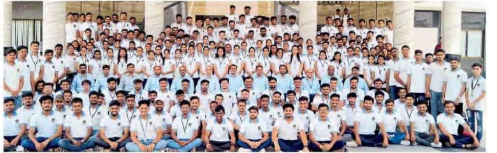
शिरपूर : पटेल अभियांत्रिकीच्या नियुक्तिपत्र विद्यार्थ्यांसह प्राचार्य, प्राध्यापकवृंद.

केलेल्या पटेल अभियांत्रिकी वीस वर्षांतच ही यशस्वी वाटचाल केली आहे. महाविद्यालयात अद्ययावत अभ्यासक्रम राबवतानाच उद्योगांच्या धर्तीवर प्रात्यक्षिकाच्या सुविधा, वर्करांस, संगणक प्रयोगशाळा उपलब्ध आहे. राष्ट्रीय आणि आंतरराष्ट्रीय स्तरावरील उद्योगांशी नियमित संपर्कात राहून त्यांच्या आवश्यकतेनुसार शिक्षण आणि प्रशिक्षणाच्या सोयी अद्ययावत करून घेतल्या जातात. विविध साफ्ट स्किल, व्यक्तिमत्त्व विकास, मुलाखत तंत्रांसह सेल्फोर्स ट्रेनिंग प्रोग्राम आदी विविध उपक्रम नियमित राबवले जातात.