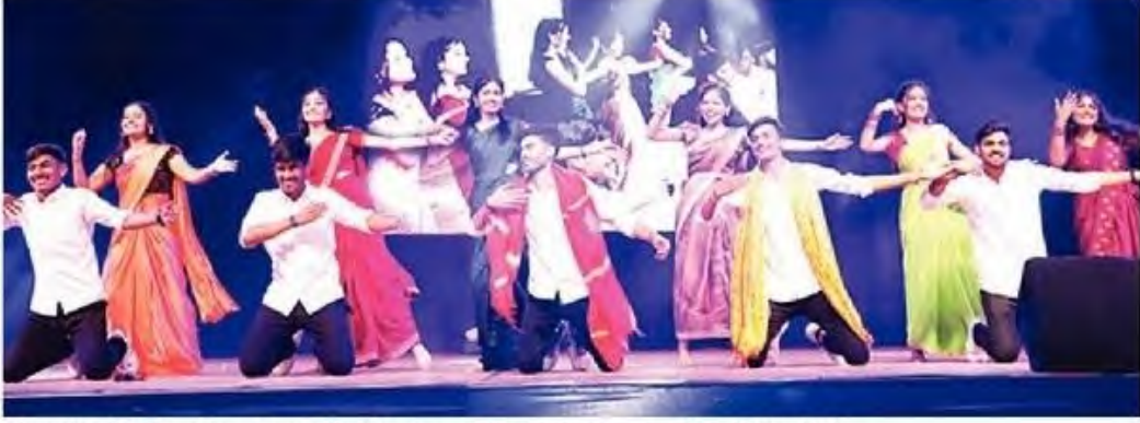
पटेल अभियांत्रिकी महाविद्यालयाच्या स्नेहसंमेलनात नृत्याविष्कार सादर करताना विद्यार्थी, विद्यार्थिनी.