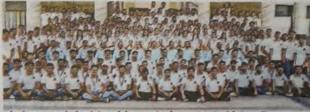
प्लेसमेंट ऑफरमुळे नोकरी मिळालेले आर. सी. पटेल अभियांत्रिकीचे विद्यार्थी.